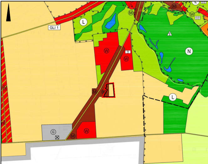
Ausschnitt aus dem wirksamen FNP mit Kennzeichnung des Änderungsbereichs, Maßstab 1: 30.000

Änderungsbereich im OT Glindow Darstellung von Sonderbaufläche mit der Zweckbestimmung "Seniorenpflegewohnen" und Wohnbaufläche